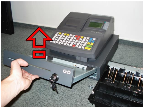
3. Nadzdvihněte posuvnou část zásuvky a vyjměte ji