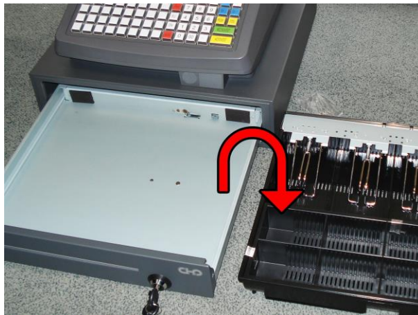
2. Vyjměte mincovník