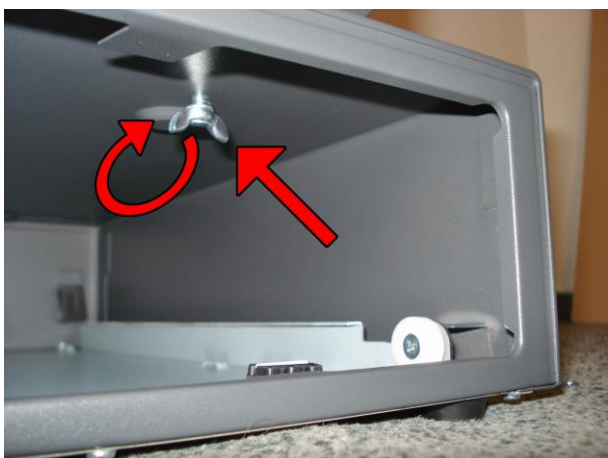
5. Přišroubujte pokladnu k zásuvce