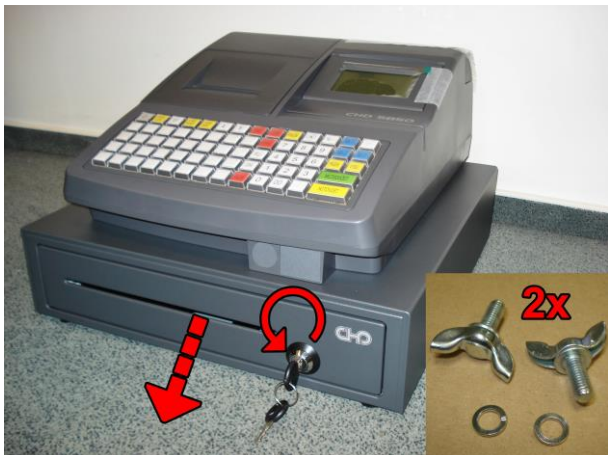
1. Otočte klíčkem vlevo, zásuvka se vysune